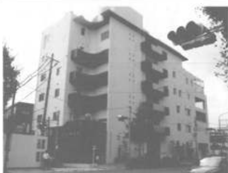
目黒本町福祉工房の外観

る。安全に過ぎた一日一日を 積み重ねていくことで、信頼 が生まれ、新しい絆へと繋が っていくと確信している。 春の足音を聞きながら、前 を向いて歩んでいきたい。