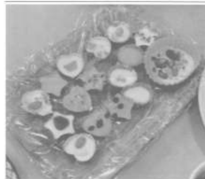
ストロベリーカフェ『チョコ作り』

いたる相談室では、在宅の サービス利用が難しい 方向けに、グループワークを 毎週火曜(ストロベリーカフ エ)と金曜(ハイビスカス)