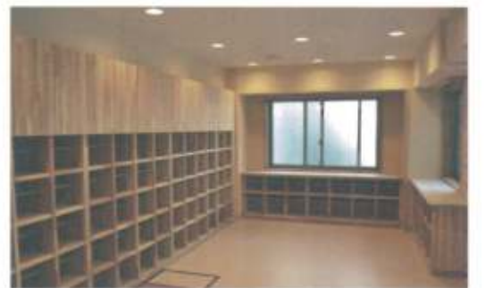
【エントランスホール】