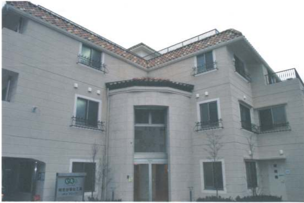
新屋舎完成！震度7に耐えられる建物です。50年先の未来を見据えています。

社会福祉法人いたる臨床発達指導センターとして創立し2012年（平成24年）9月11日に45周年を迎えます。創立時の精神「いたる文化」は、「障がいも重くても、働く意思があれば、施設を利用していただく」という事です。働くことにより社会参加し所得を得て自立を促し、社会のお役に立つヒトになって欲しいという願いも込められています。 いたるセンターの名称の意味は、「臨床II医療・福祉・労働の現場」「発達II発達支援」「指導II就労指導」「センターII中心（日本・東京の中心）」は、単に杉並区のみならず、日本・東京の福祉の中心」として自主独立の運営を